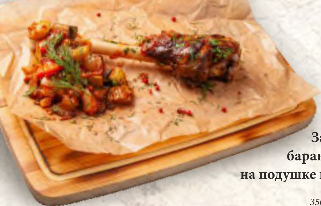
Запеченная баранья голень на подушке из овощей