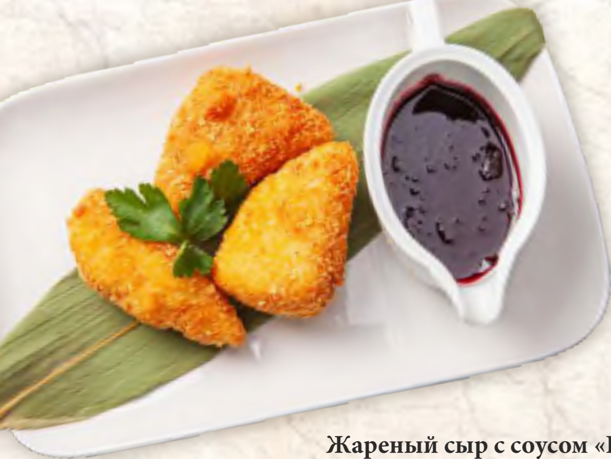
Жареный сыр с соусом «Порто»