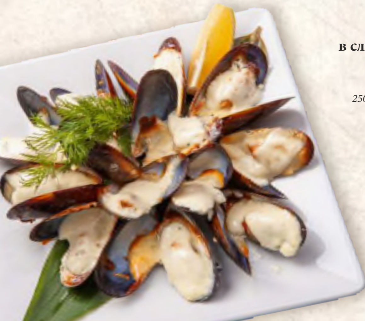
Мидии в сливочном соусе