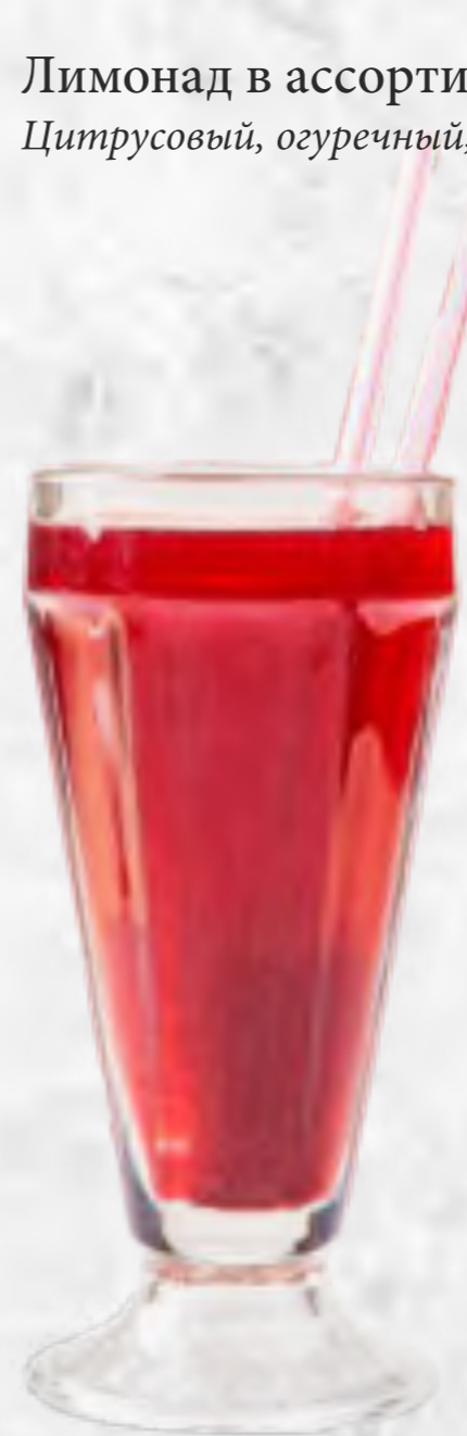
Морс ягодный 300 р. 300 мл