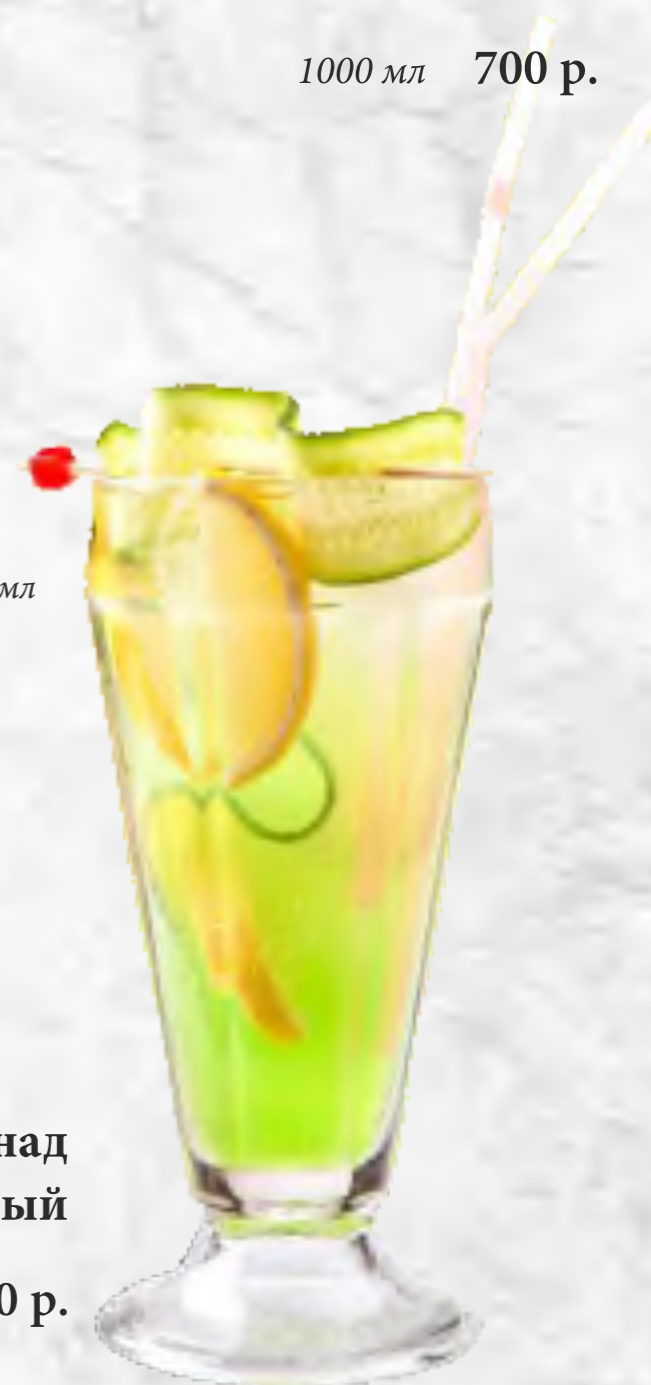
Лимонад огуречный 1000 мл 700 р.