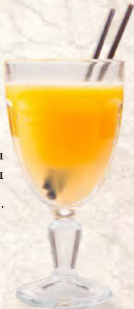
Фреш грейпфрут 350 р. 200 мл